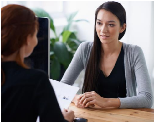
Devis de l'étude Phénoménologique