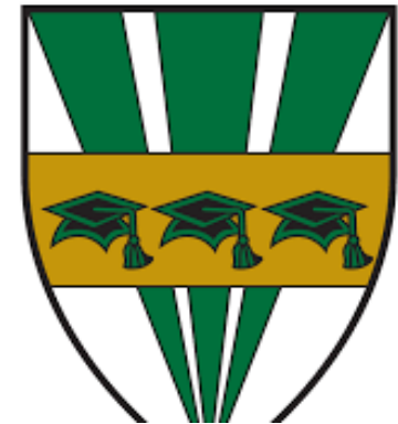
Certificat éthique CÉR UQTR