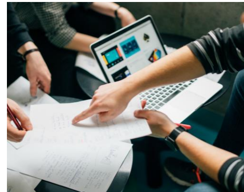
Analyse qualitative Trois analystes