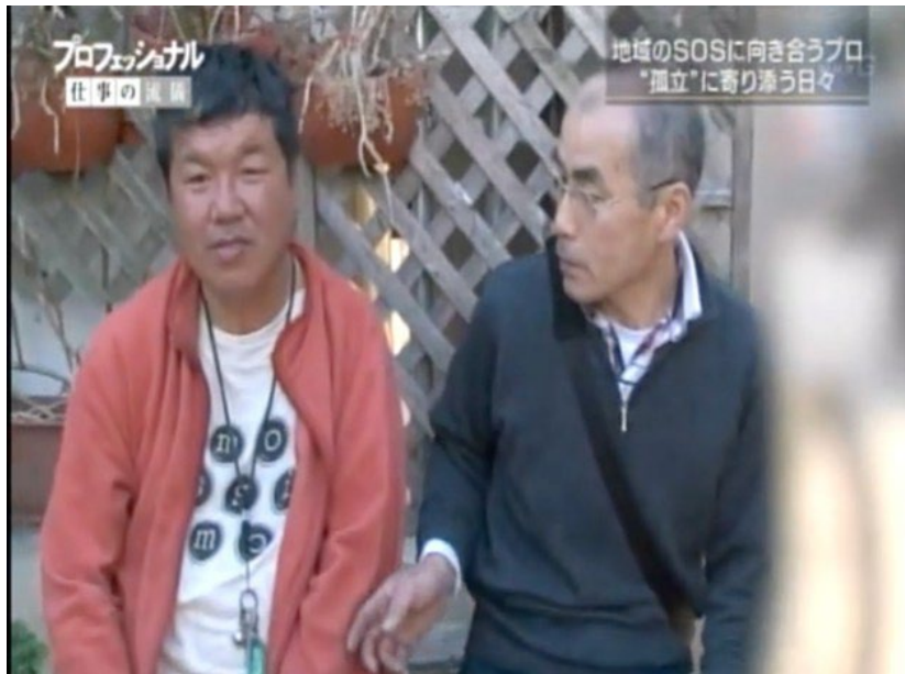
Personne handicapé, dépendance à l'alcool et HIKIKOMORI, qui avait syndrome de Diogène. Voisin qui vient lui parler à chaque sortie de la maison