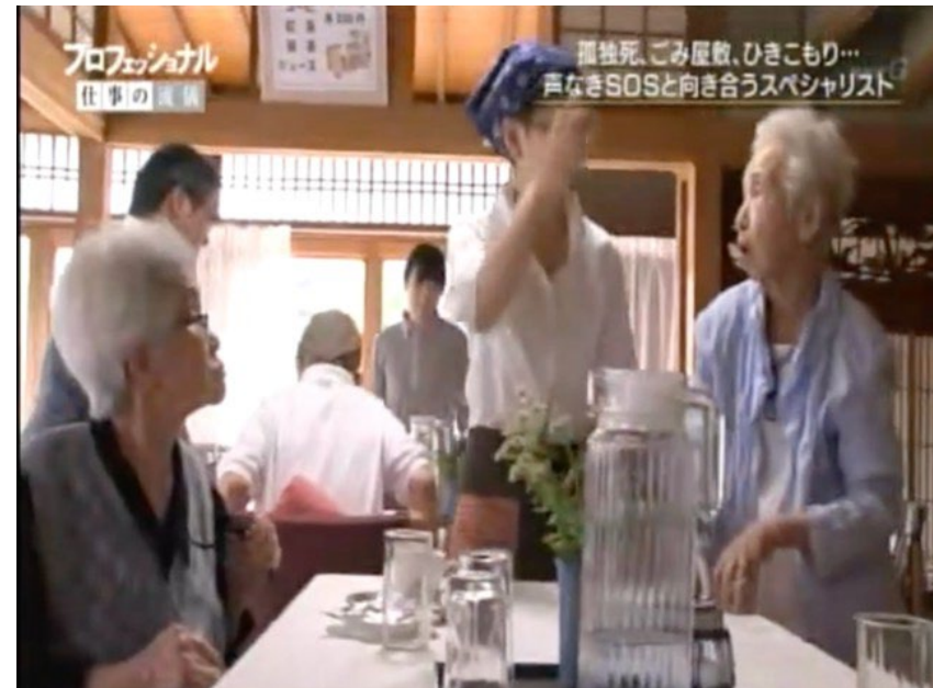
Lieu qui accueille les habitants, menés par les bénévoles du quartier.