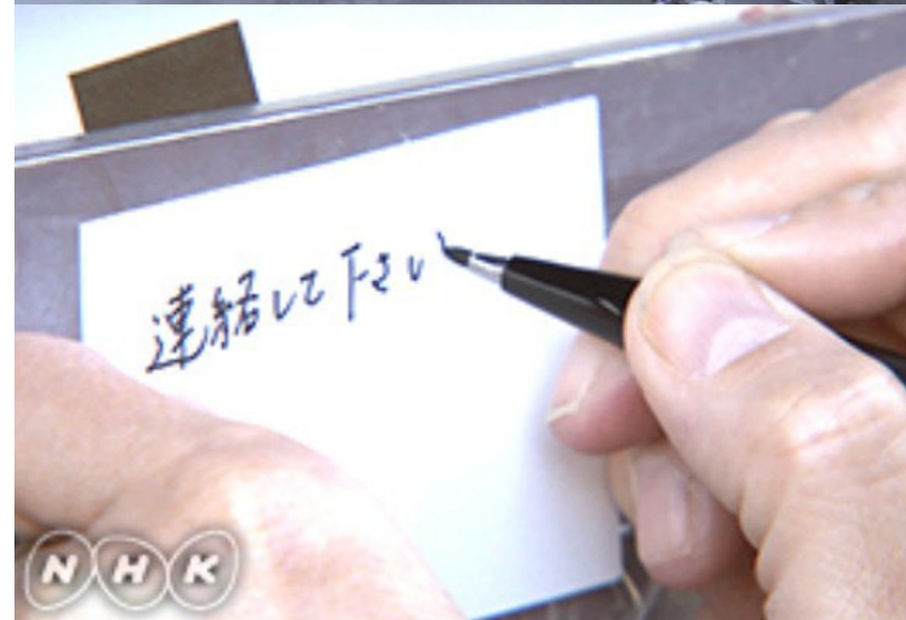
Prise de contact Messages laissés régulièrement Aussi par téléphone